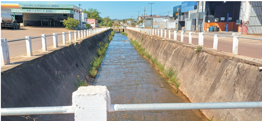
Canal de macrodrenagem retificado