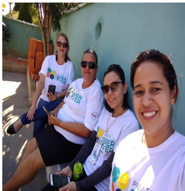
Figuras 27 e 28. Aplicação de questionários de Estudos Sociais nas zonas urbana e rural