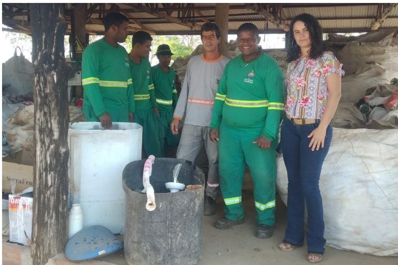
Figura 29. Aplicação de questionários de Estudos Sociais na cooperativa de catadores de Teixeiraópolis