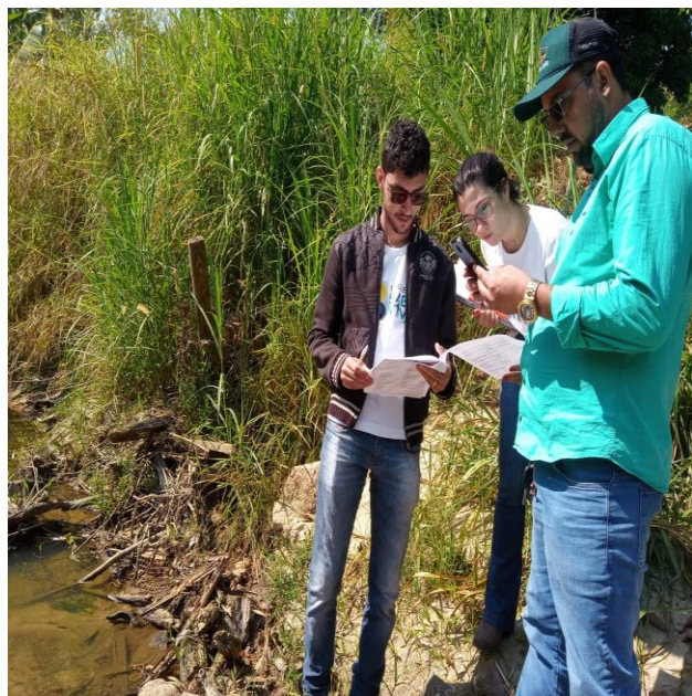
Figura 12 e 13. Planejamento das atividades que envolvem os 4 componentes do PMSB