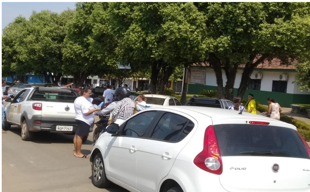
Figura 2. Pit stop sendo realizado, abordagem de veículos para ser entregue convites