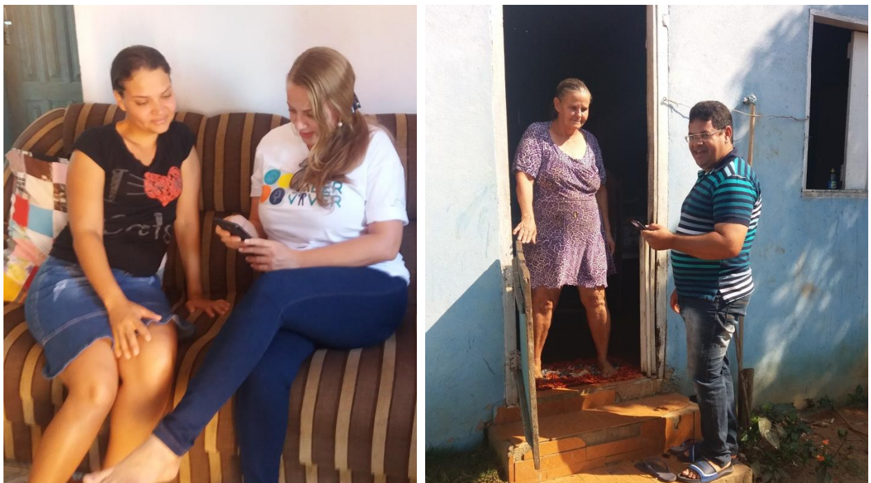
Figuras 21 e 22. Aplicação de questionários de Estudos Sociais nas zonas urbana e rural

Av. Afonso Pena, 2280 – CEP 76928-000 - Teixeiraópolis - RO Telefone: (69) 3465-1112