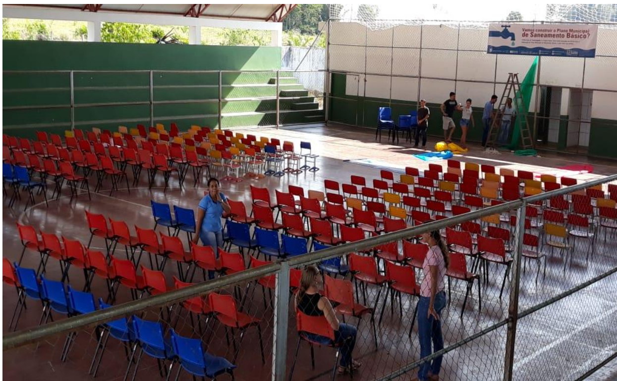
Figura 3. Organização do local do Evento

2) No dia 02 de agosto as 15h00 na Quadra de Esportes José de Matos onde os membros dos comitês iniciaram a organização para acomodar e recepcionar os munícipes, foram colocadas 300 cadeiras em fileiras e na frente foi montada a mesa de solenidades para acomodar autoridades, além de faixas/banners, foi instalado data show com tela para que todos pudessem acompanhar a apresentação do Plano Municipal de Saneamento Básico em construção.