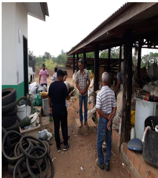
Figura 18. Visita na estação de triagem dos resíduos sólidos