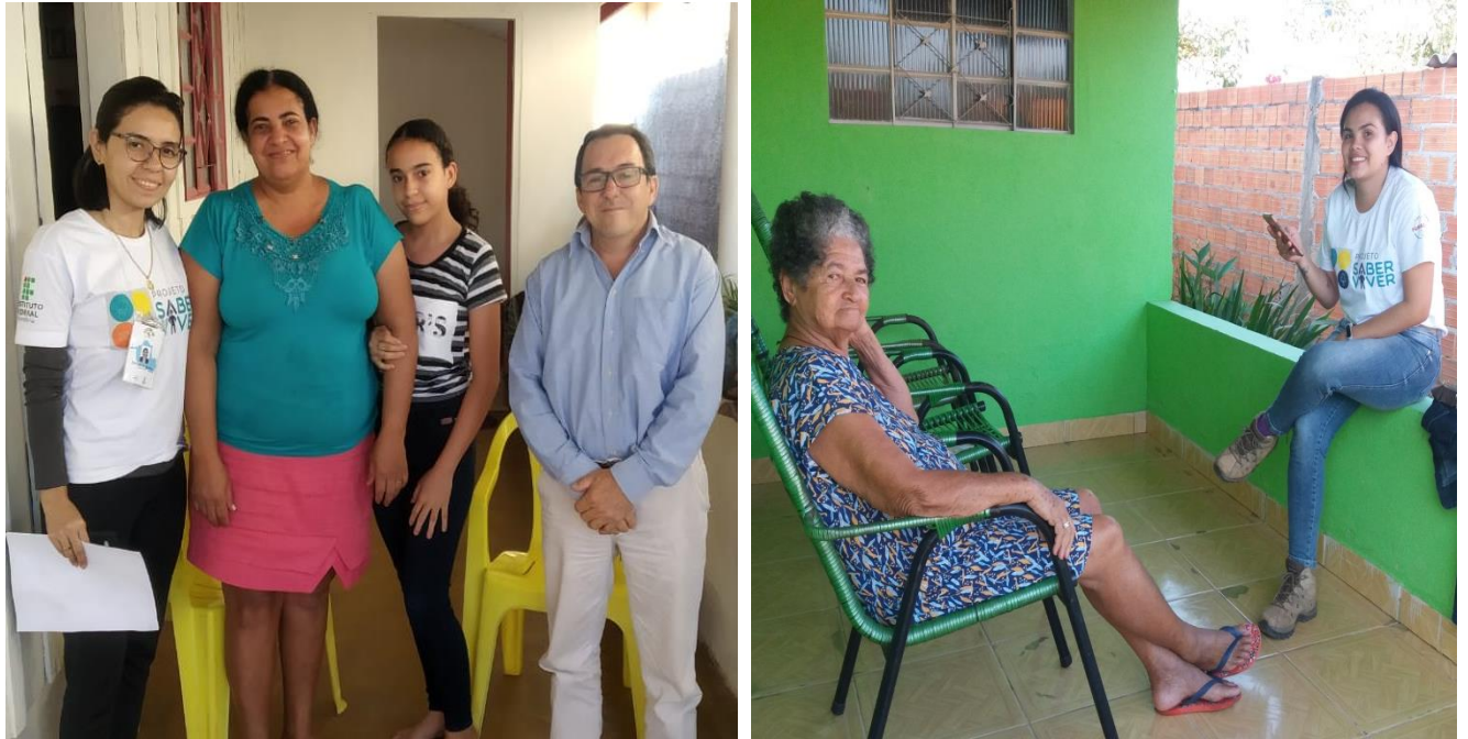
Figuras 19 e 20. Aplicação de questionários de Estudos Sociais nas zonas urbana e rural