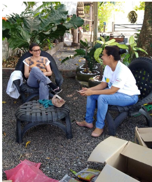
Figuras 25 e 26. Aplicação de questionários de Estudos Sociais nas zonas urbana e rural