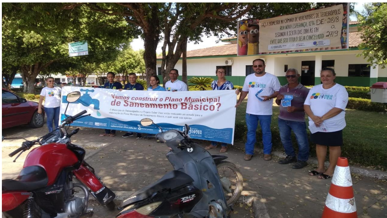
Figura 1. Equipe dos comitês iniciando o pit stop na Avenida Afonso Pena