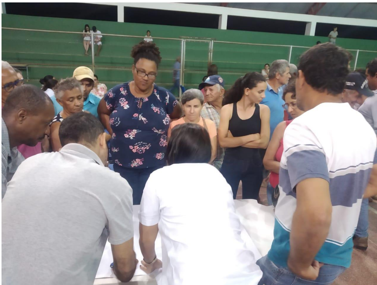
Figura 10. Execução da atividade em grupos mapa falada zona rural.