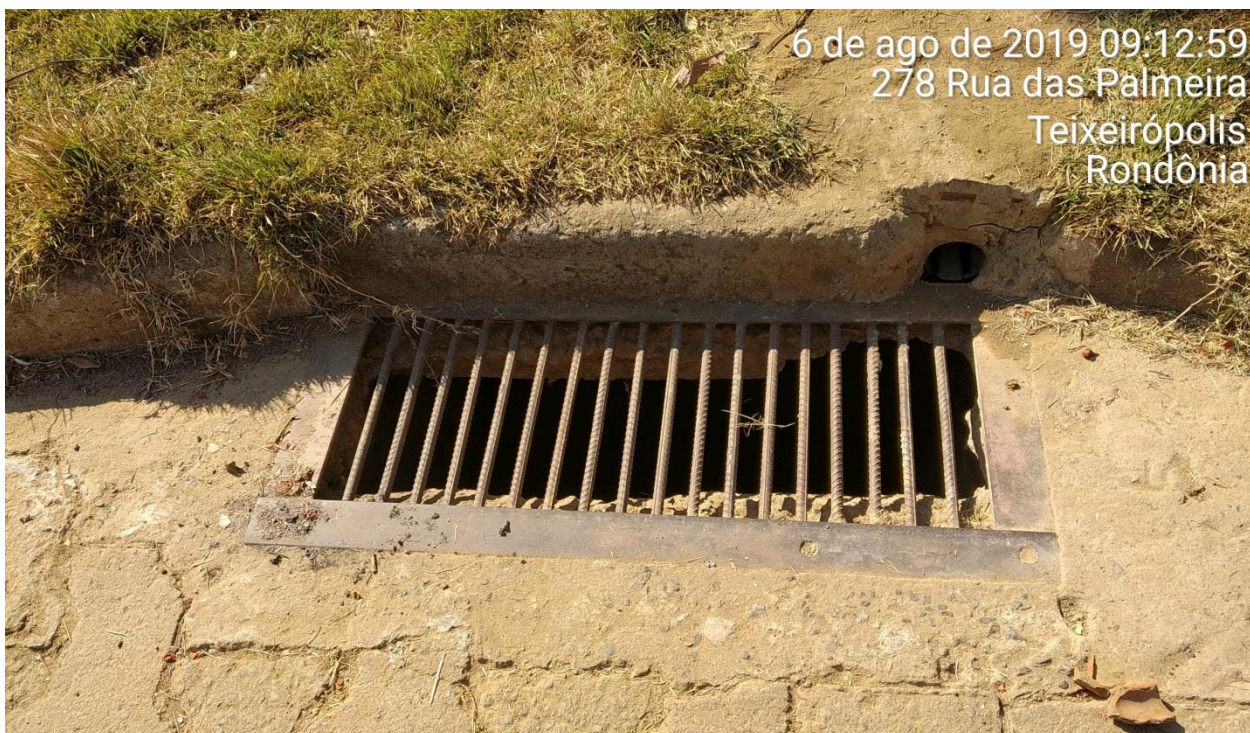
Figura 14. Registro das bocas de lobos existentes.