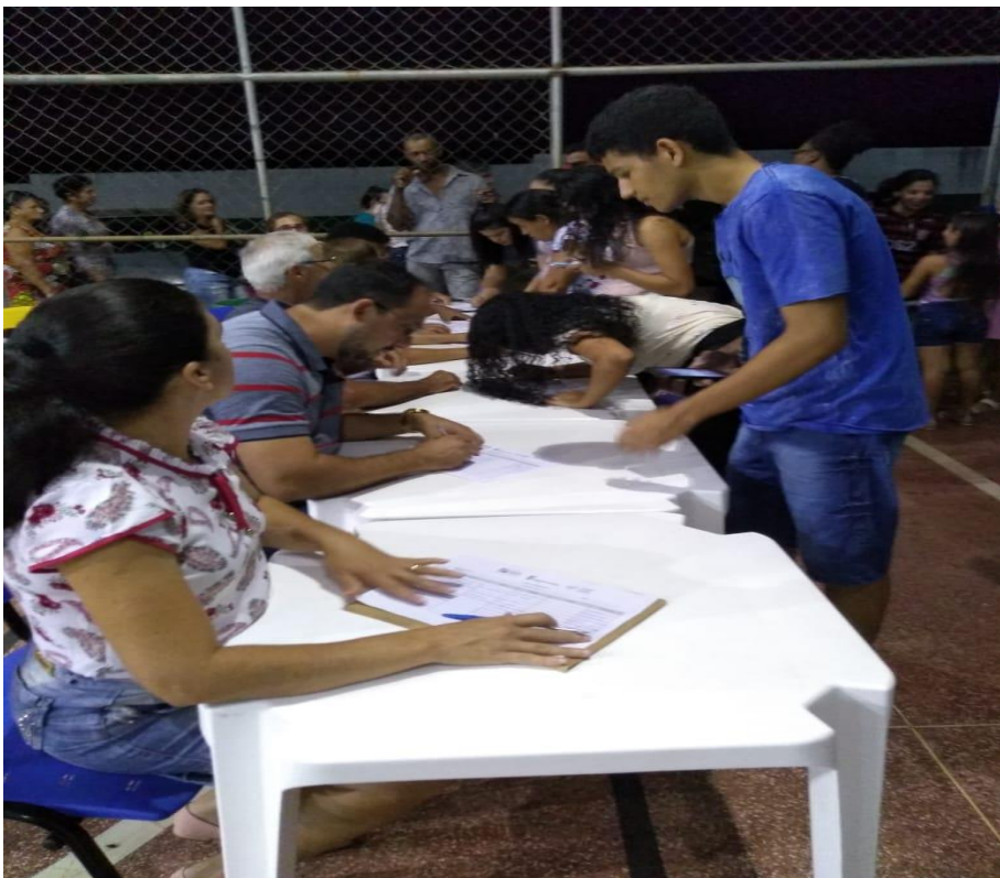
Figura 5. Recepção e ponto de coletas de assinatura nas Listas de presença