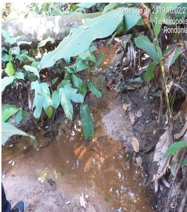
Figura 16. Visita na nascente do rio Cornélio