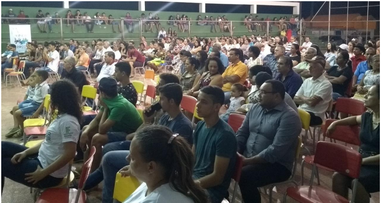
Figura 5. Momento da abertura oficial da 1ª Audiência pública