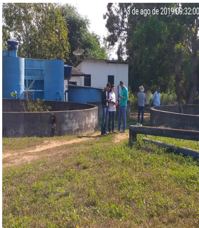
Figura 17. Visita na ETA Estação de Tratamento de água