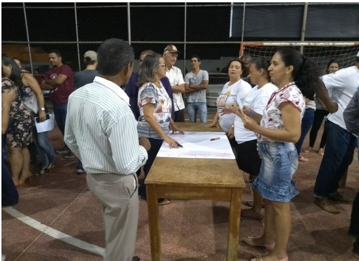
Figura 11. Execução da atividade em grupos mapa falado zona urbana