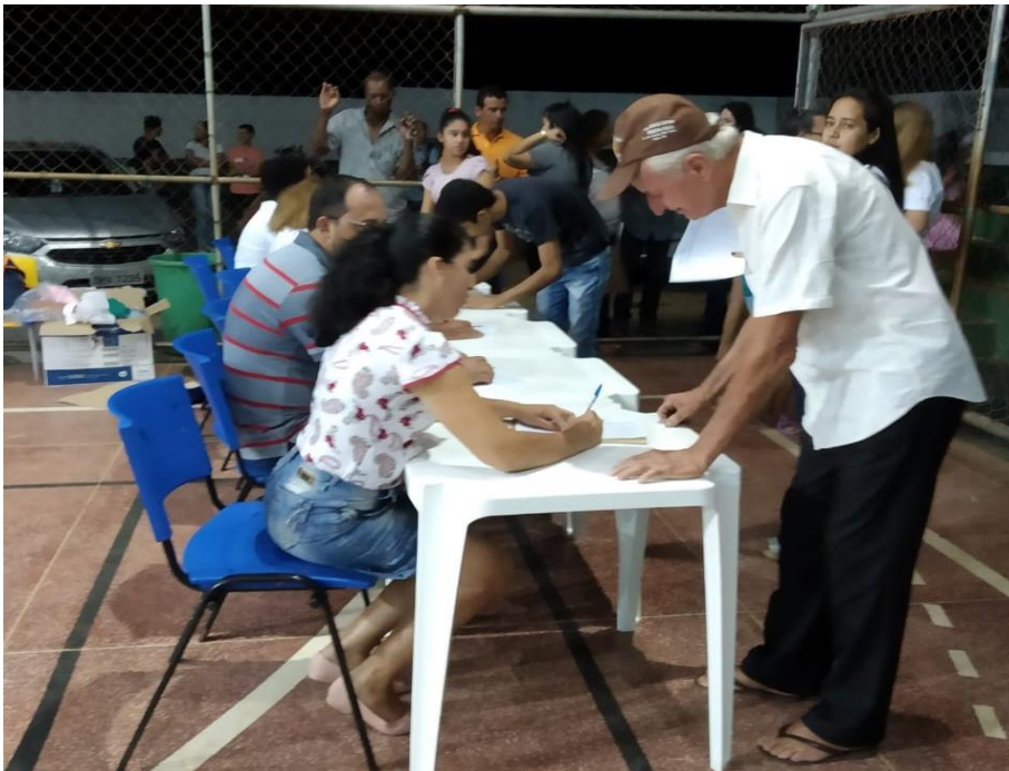
Figura 4. Recepção e ponto de coletas de assinatura nas Listas de presença