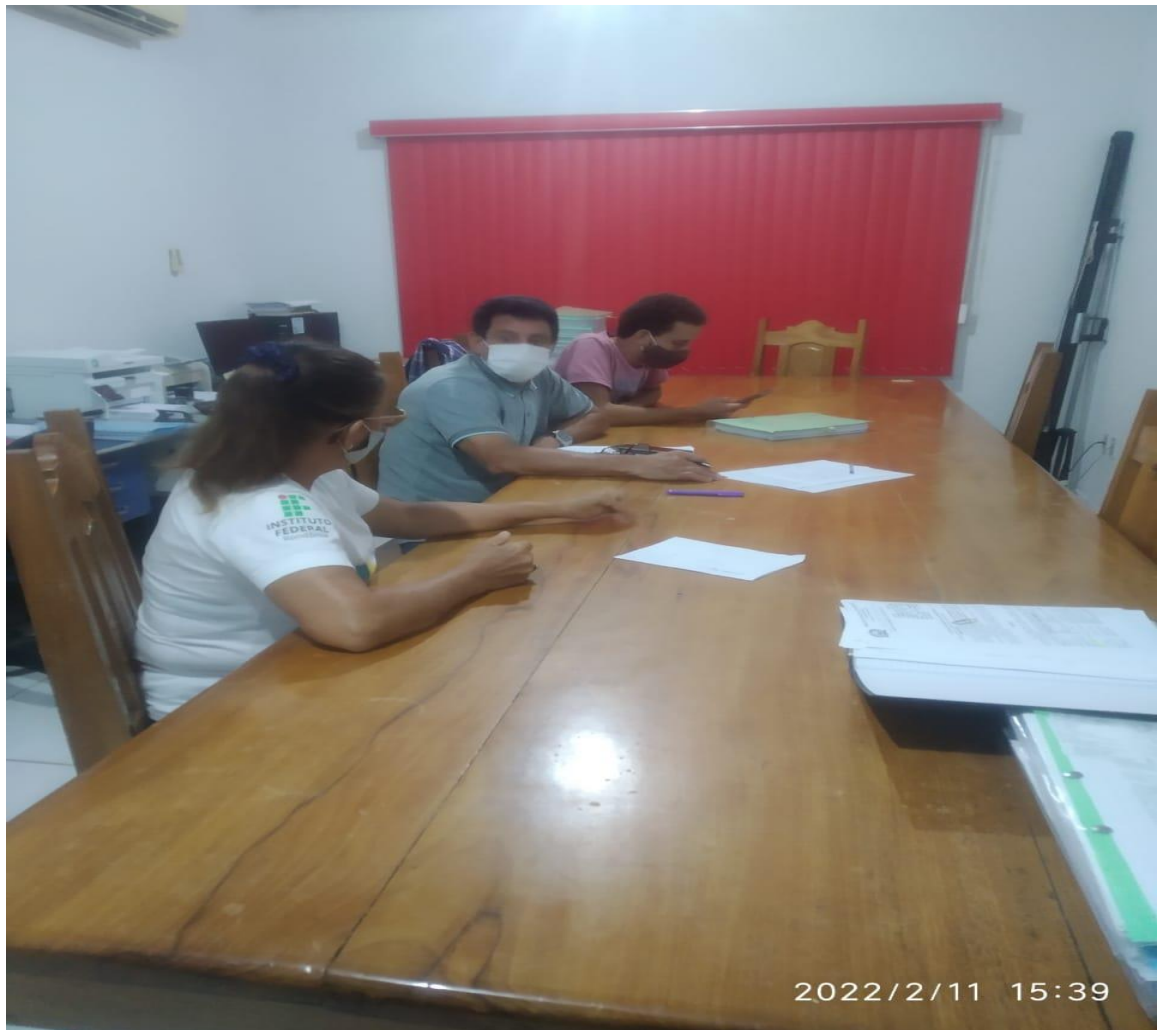
Figura 5: Reunião dia 11 de fevereiro de membros do PMSB para divisão das tarefas.