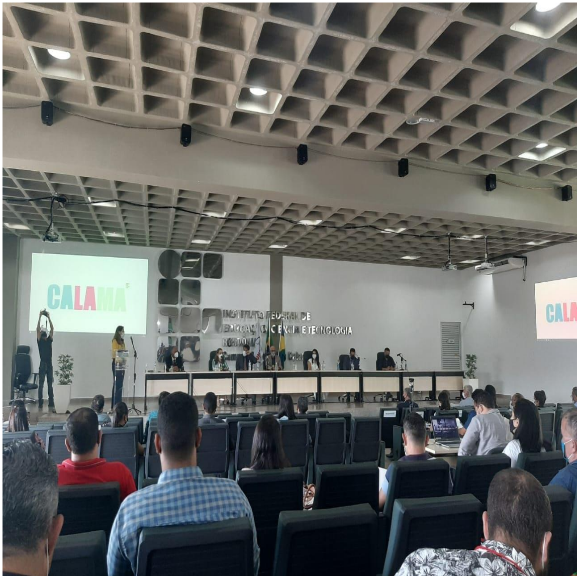
Figura 4: Evento no município de Porto Velho, com o tema “O Plano Municipal de Saneamento Básico (PMSB) diante da atualização do Marco Regulatório”.