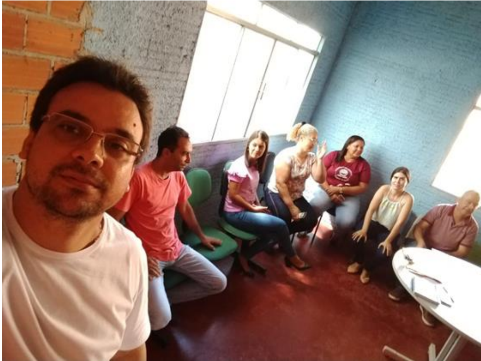
Figura 2 – Reunião dos Comitês na Secretaria de Educação.