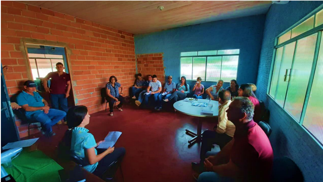
Figura 2 – Reunião dos Comitês na Secretaria de Educação.

No dia 21 de outubro de 2019, às 8h00min, na Secretaria de Educação, reuniram-se os membros do Comitê de Execução e membros do Comitê de Coordenação, para entregar da parte descritiva do Produto C. Cada secretaria trouxe seus levantamentos, porém foi decidido em reunião que a secretaria de Agricultura juntamente com a secretaria de saúde ficaram responsáveis por terminar o levantamento até o dia 23 de outubro de 2019 e encaminhar por e-mail, em virtude da dificuldade de fazer esses levantamentos foram estendido mais uns dias (Figura 2).