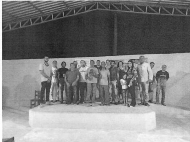
Figura 9 – Reunião Setorizada na Escola do Críveli