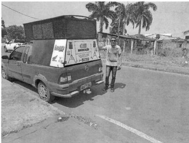
Figura 17 – Parceria com Elmir do Carro de Som