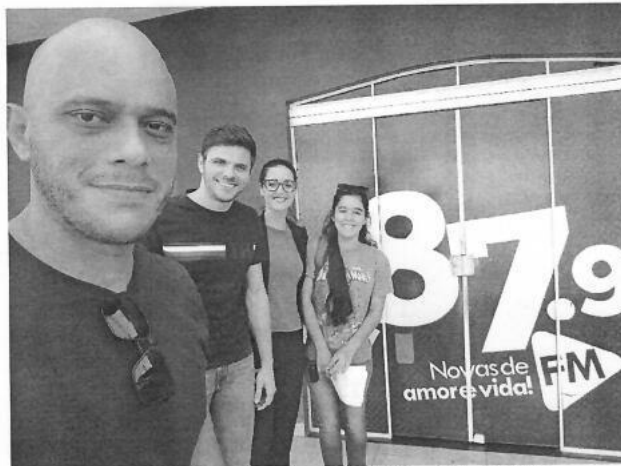
Figura 11 – Parceria com a REDETV e rádio FM 87.9

Além da realização das Audiências Públicas para apresentação do PMSB, também foram desenvolvidas outras atividades relacionadas a mobilização no mês de setembro. Entre estas atividades podemos citar: entrevistas em rádios, entrevistas à TV local, parceria com a SEDUC, palestras com os estudantes das escolas, entre outras.