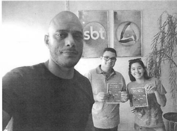
Figura 13 – Parceria com o SBT/TVALLAMANDA

ESTADO DE RONDÔNIA PREFEITURA MUNICIPAL DE PIMENTA BUENO