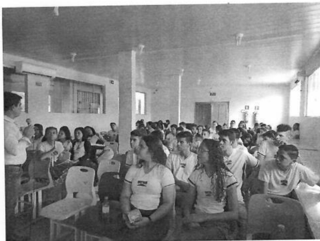
Figura 21 – Palestra com os alunos da Escola

ESTADO DE RONDÔNIA PREFEITURA MUNICIPAL DE PIMENTA BUENO