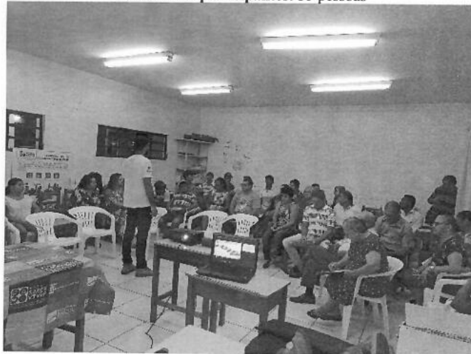
Figura 4 – Reunião Setorizada no Itaporanga

1ª Reunião Setorizada no Urucumacã – Setor 7