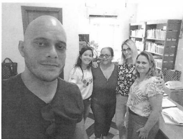
Figura 18 – Parceria com a SEDUC