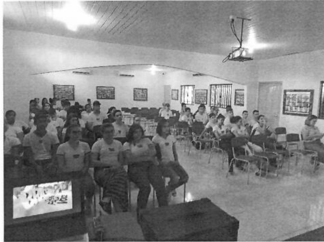
Figura 19 – Palestra com os alunos da Escola Raimundo Euclides