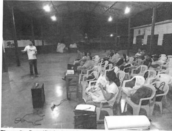
Figura 2 – Reunião Setorizada na Escola Nair Barros

1ª Reunião Setorizada no Abaitará – Setor 5