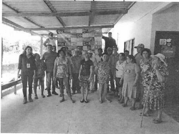
Figura 5 – Reunião Setorizada no Urucumacã

Data: 14/09/2019 Horário: 09h00min Local: Escola Urucumacã Número de participantes: 33 pessoas