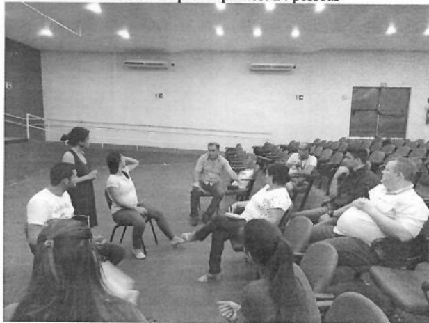
Figura 1 – Reunião com os Comitês Executivo e de Coordenação na Prefeitura

Data: 09/09/2019 Horário: 16h00min Local: Prefeitura Número de participantes: 24 pessoas