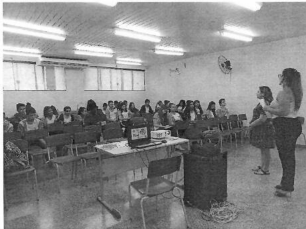
Figura 20 – Palestra com os alunos da Escola Cordeiro de Farias