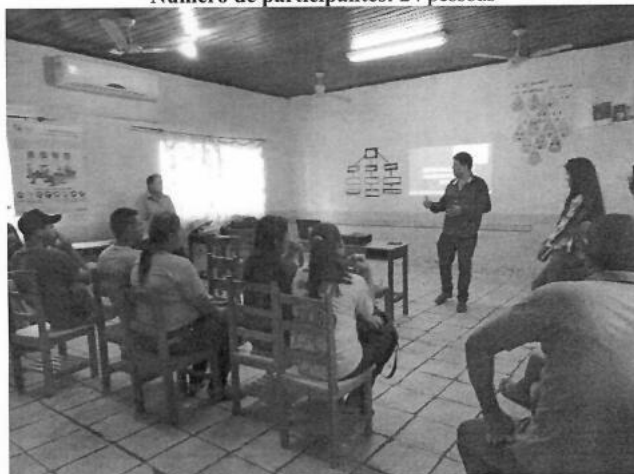
Figura 8 – Reunião Setorizada na Escola Luís Cabral

Data: 16/09/2019 Horário: 09h00min Local: Escola Luís Cabral Número de participantes: 24 pessoas