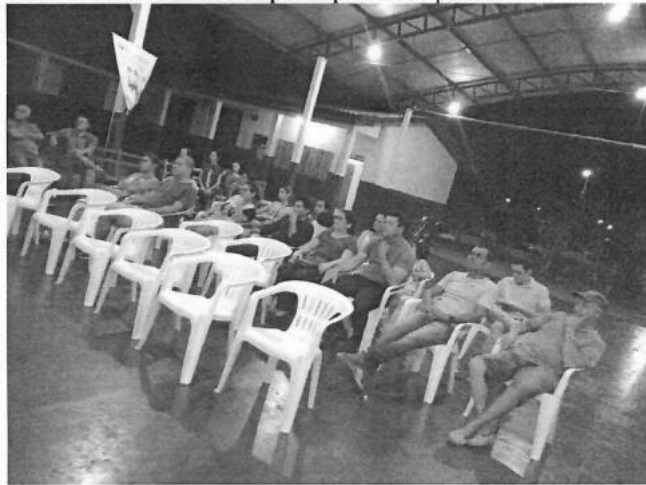
Figura 10 – Reunião Setorizada na Escola Lairce Santiago

Data: 24/09/2019 Horário: 19h00min Local: Escola Lairce Santiago Número de participantes: 30 pessoas