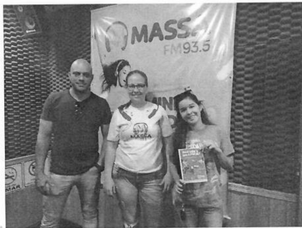
Figura 12 – Parceria com a MASSA FM 93.5