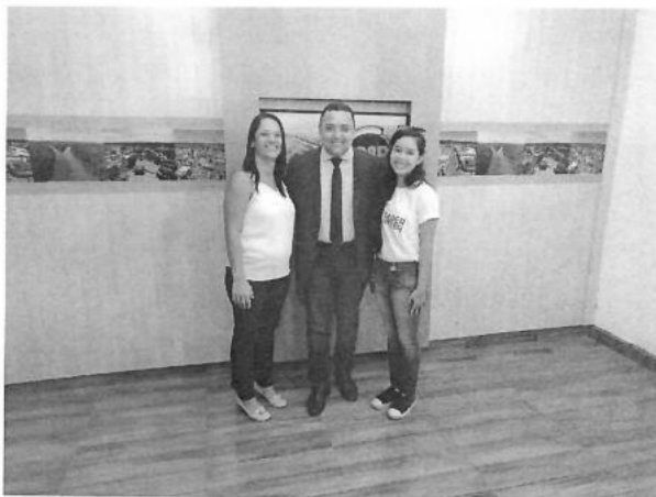
Figura 15 – Entrevista no programa Cidade Agora (SBT/TVALLAMENDA)

ESTADO DE RONDÔNIA PREFEITURA MUNICIPAL DE PIMENTA BUENO