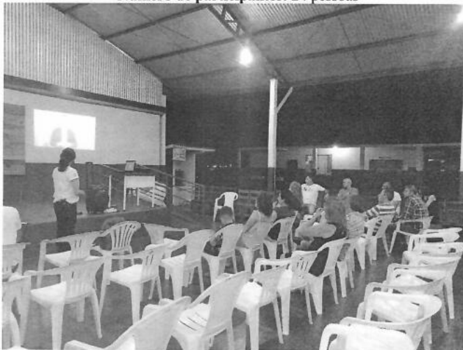
Figura 6 – Reunião Setorizada na Escola Lairce Santiago (CANCELADA)

Data: 14/09/2019 Horário: 19h00min Local: Escola Lairce Santiago Número de participantes: 24 pessoas