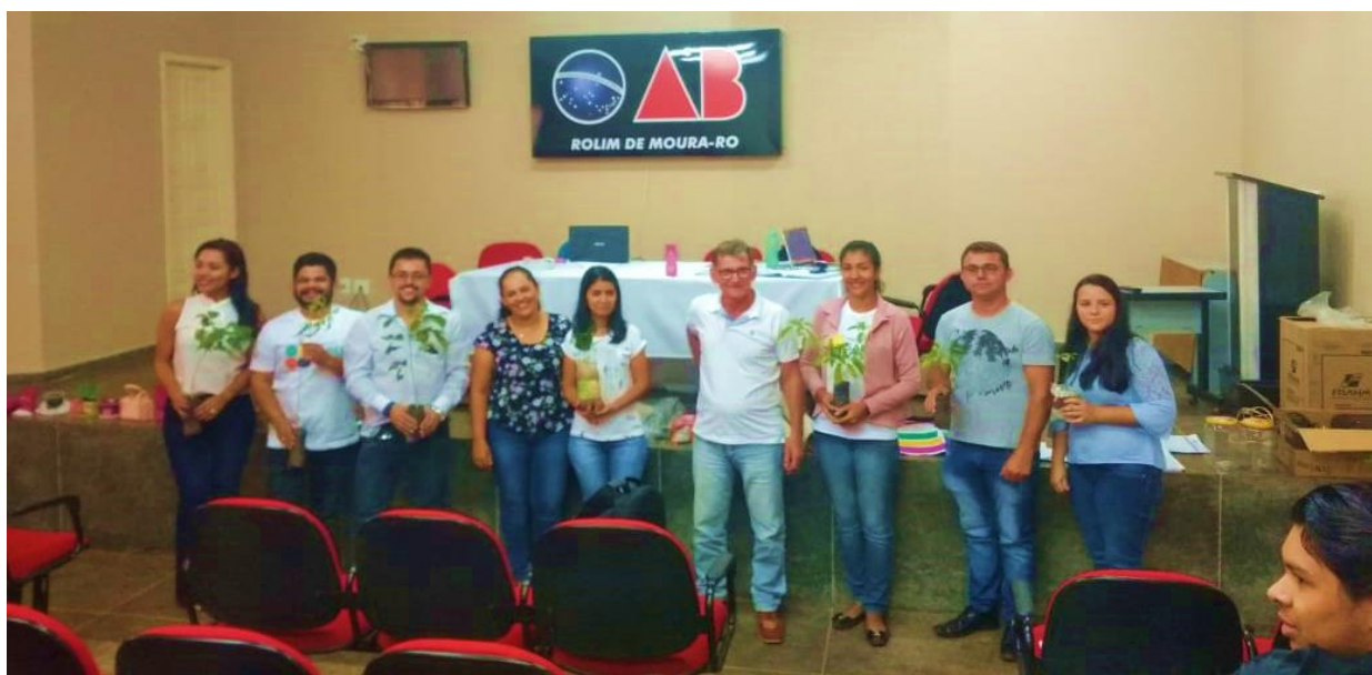
Figura 3 – Capacitação em Rolim de Moura

Aconteceram várias oficinas de apresentação desses componentes para conhecer a realidade dos municípios que estavam presentes, no final da capacitação houve uma troca de mudas entre os municípios (Figuras 3, 4 e 5).