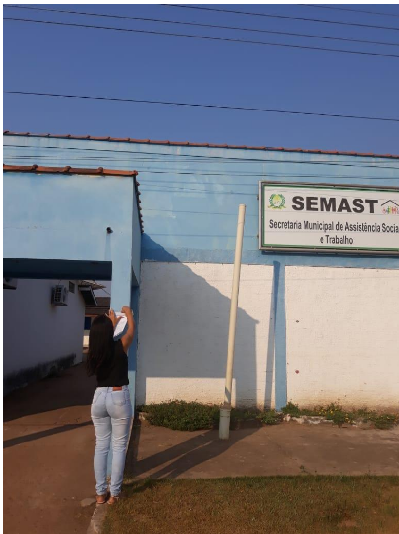
Figura 11 – Convites fixados nos órgãos e Empresas do Município.

Rua Jair Dias, Nº 150, Bairro Centro, Parecis/RO, CEP: 76.979-000; srp.pmparecisro@hotmail.com ; Fone: (69) 3447-1129/1256/1051/1205.