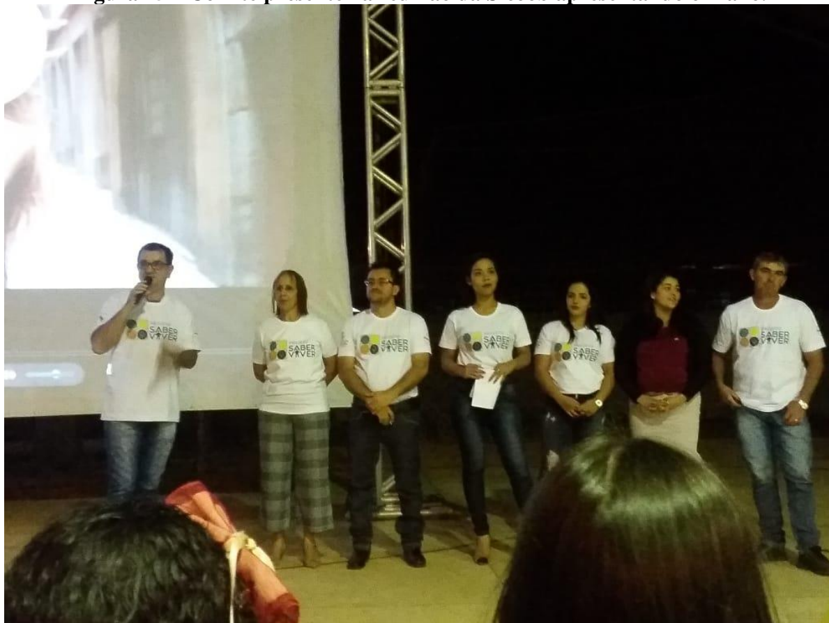
Figura 15 – Comitê presente na reunião da Sicoob apresentando o Plano.

Rua Jair Dias, Nº 150, Bairro Centro, Parecis/RO, CEP: 76.979-000; srp.pmparecisro@hotmail.com ; Fone: (69) 3447-1129/1256/1051/1205.