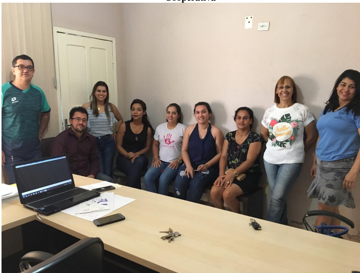
Figura 14 – Reunião para discutir a estratégia a ser apresentada na reunião da Cooperativa

No dia 02 de Agosto de 2019 foi realizada a segunda Reunião Extraordinária com os comitês de Coordenação e Execução na Prefeitura Municipal, com objetivo de apresentar o Plano de Saneamento Básico para a população na reunião da cooperativa de crédito Sicoob, como estratégia de mobilização (Figura 14 e 15).