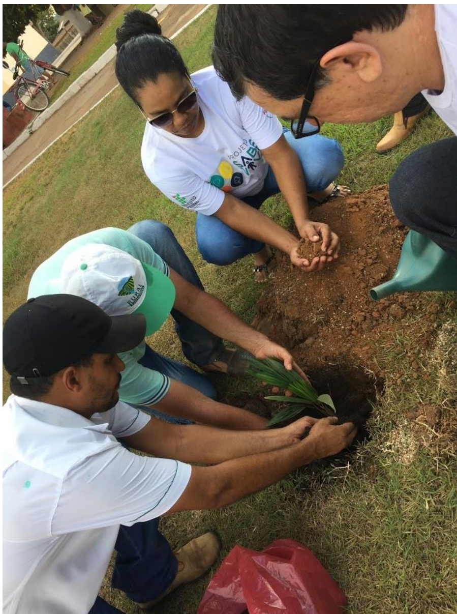
Figura 8 – Plantação das mudas em praça pública

Rua Jair Dias, Nº 150, Bairro Centro, Parecis/RO, CEP: 76.979-000; srp.pmparecisro@hotmail.com ; Fone: (69) 3447-1129/1256/1051/1205.