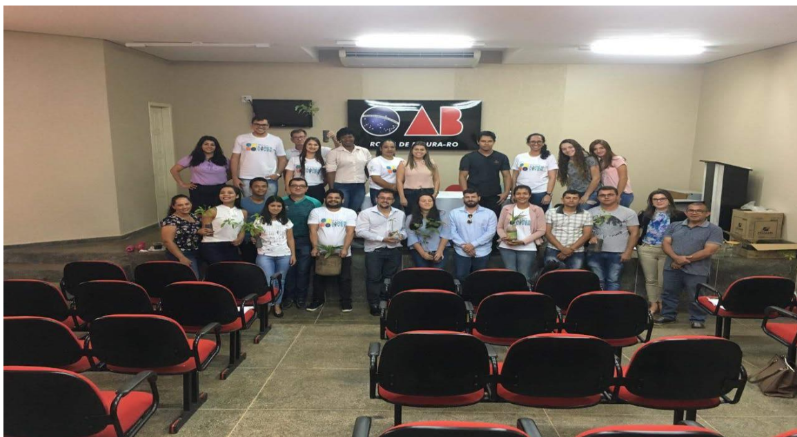
Figura 5 – Apresentação dos trabalhos em plenária.