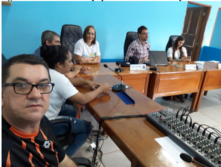
Figura 10 – Reunião da equipe na Câmara Municipal

Rua Jair Dias, Nº 150, Bairro Centro, Parecis/RO, CEP: 76.979-000; srp.pmparecisro@hotmail.com ; Fone: (69) 3447-1129/1256/1051/1205.