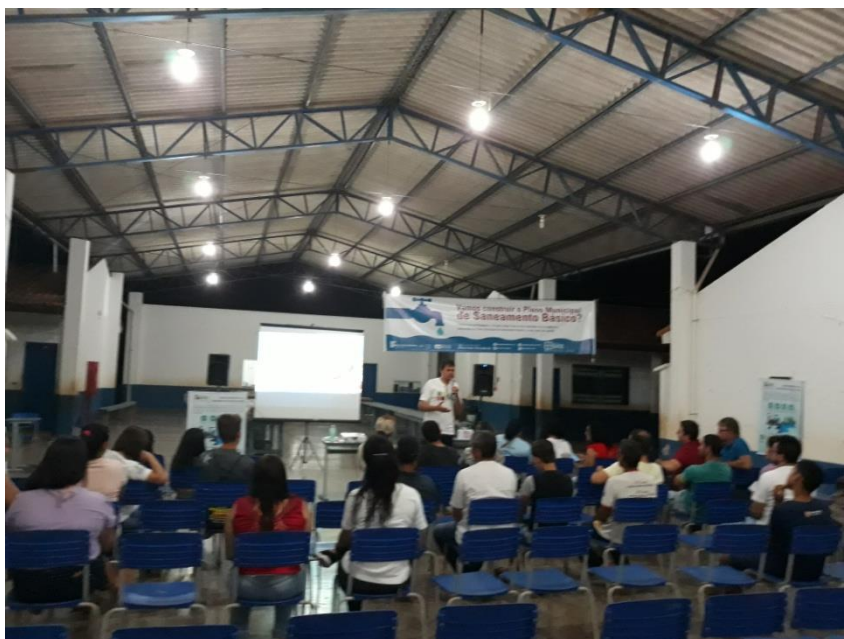
Figura 13- Desenvolvimento das atividades Zona urbana