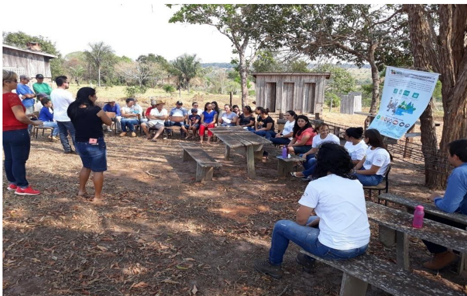
Figura 7- Desenvolvimento das atividades Linha 105