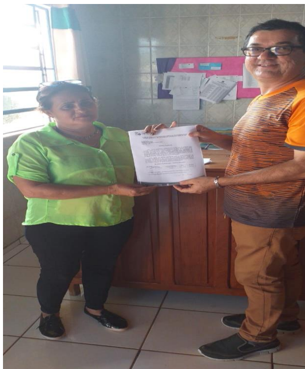
Figura 3 – Entrega de convite a Líder de comunidade .

Rua Jair Dias, Nº 150, Bairro Centro, Parecis/RO, CEP: 76.979-000; srp.pmparecisro@hotmail.com ; Fone: (69) 3447-1129/1256/1051/1205.