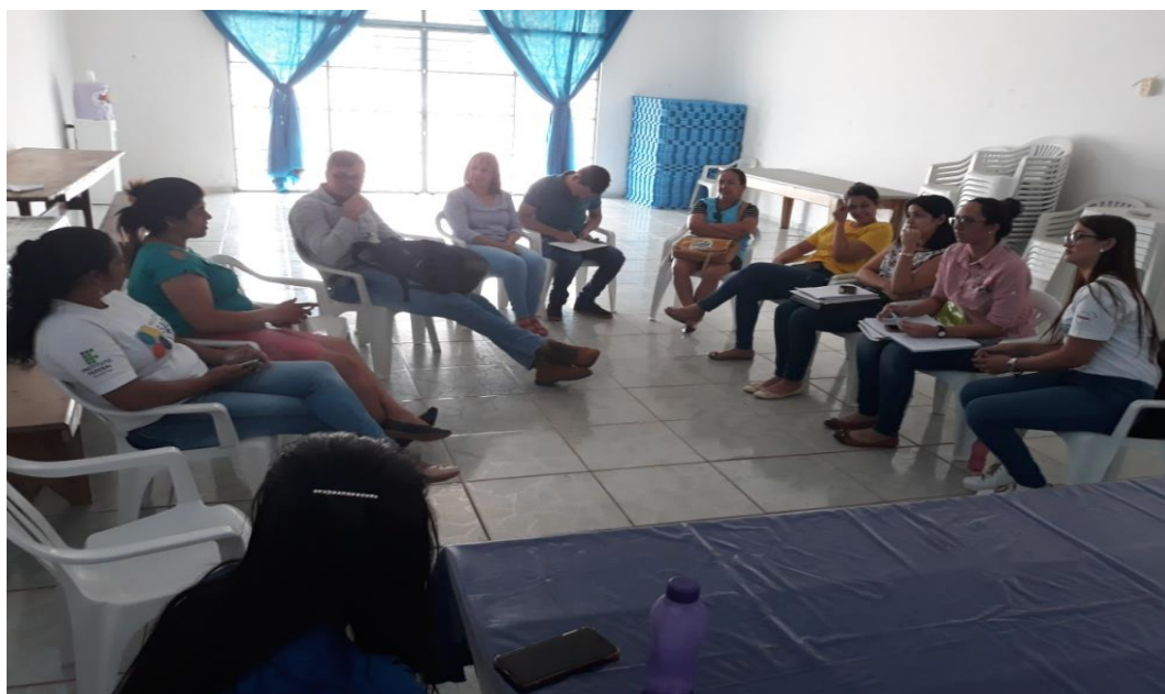
Figura 1- Reunião de nivelamento pré-audiência pública