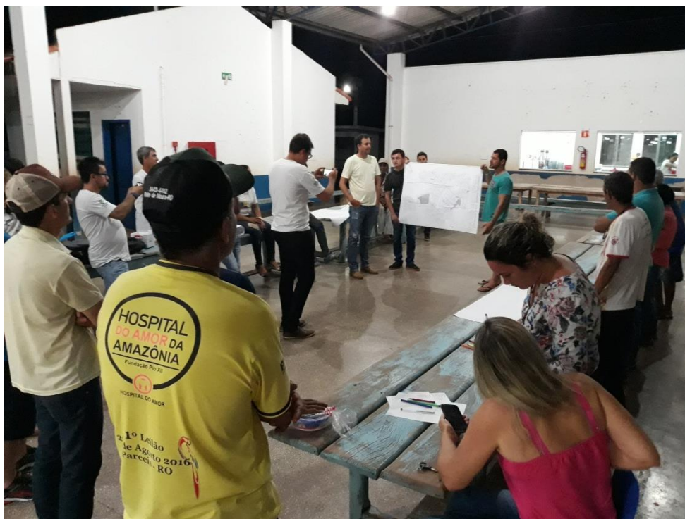
Figura 14- Apresentação das atividades Zona Urbana

Rua Jair Dias, Nº 150, Bairro Centro, Parecis/RO, CEP: 76.979-000; srp.pmparecisro@hotmail.com ; Fone: (69) 3447-1129/1256/1051/1205.