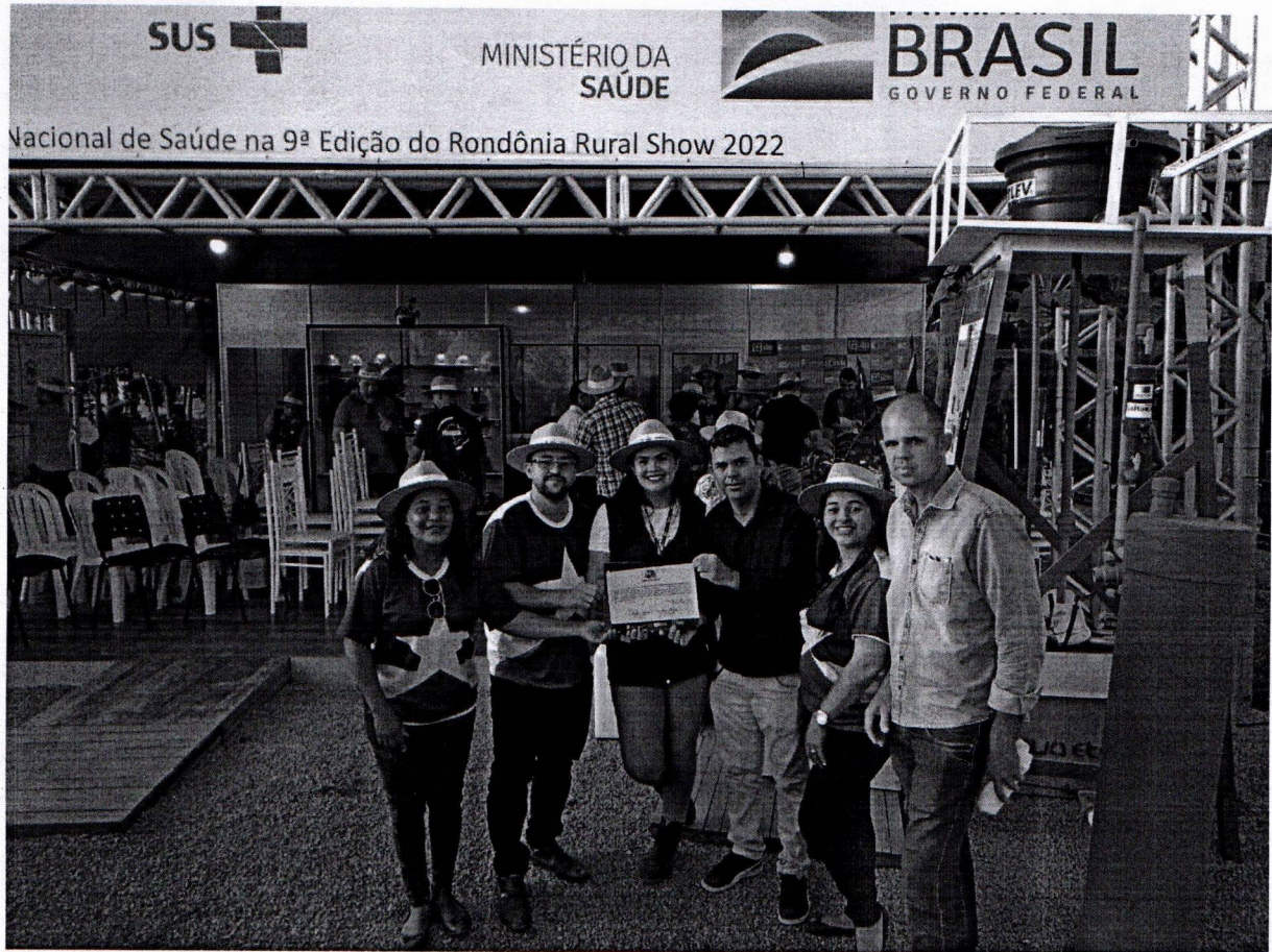
Figura 3: Entrega do certificado de conclusão do PMSB no stand da Funasa na Rondônia Rural Show.