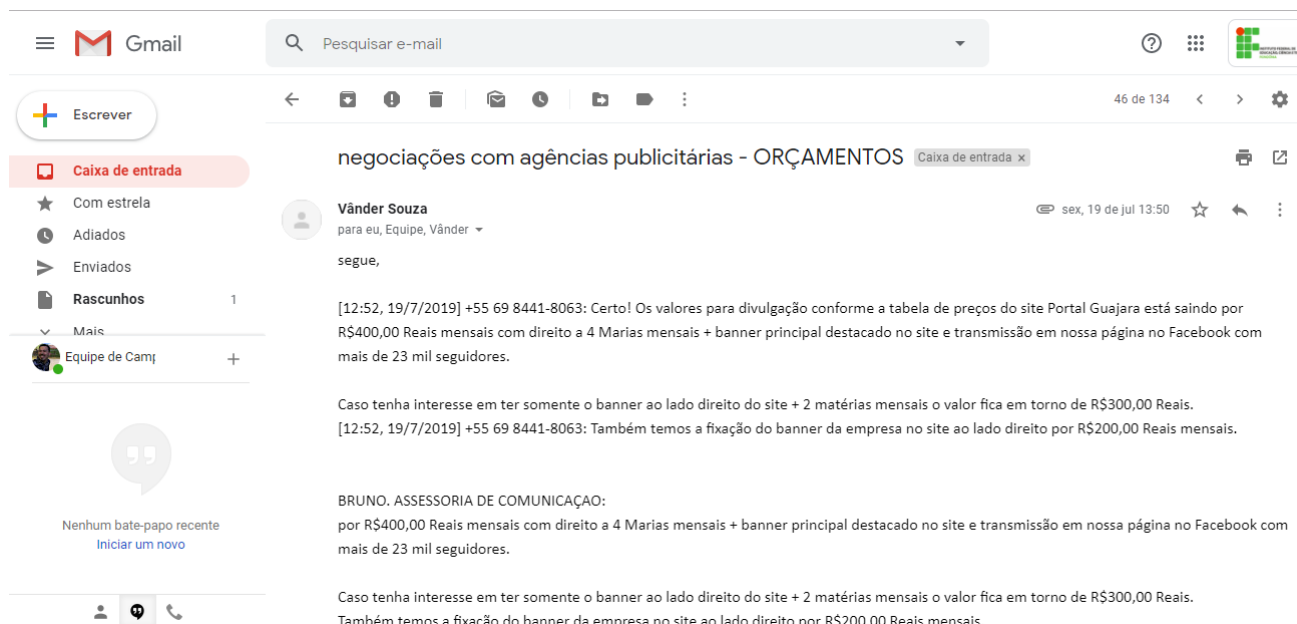
Figura 3 E-mail do coordenador suplente do comitê de coordenação com dados orçamentários

No dia 19 de Julho foi enviado para a Equipe do Projeto Saber Viver alguns dados de cotações para a mobilização e comunicação para a etapa do diagnóstico.