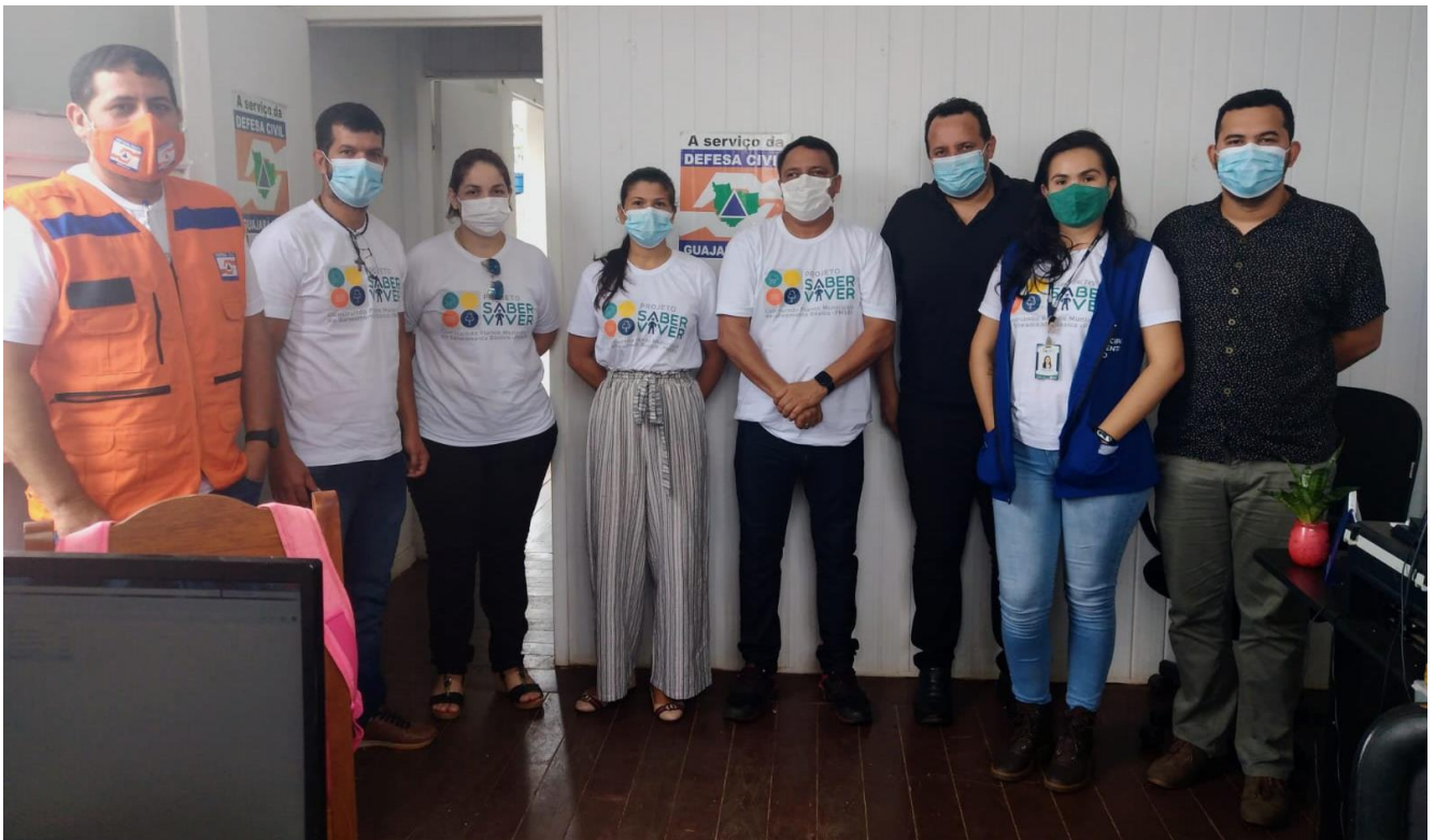
Figura 1: Reunião com os coordenadores e membros dos Comitês de Saneamento Básico na Defesa Civil de Guajará-Mirim.