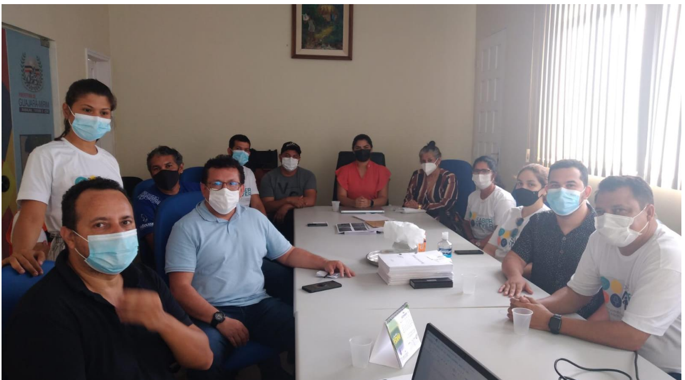
Figura 4: Reunião com Prefeita, coordenadores e membros dos Comitês de Saneamento Básico na Prefeitura de Guajará-Mirim.