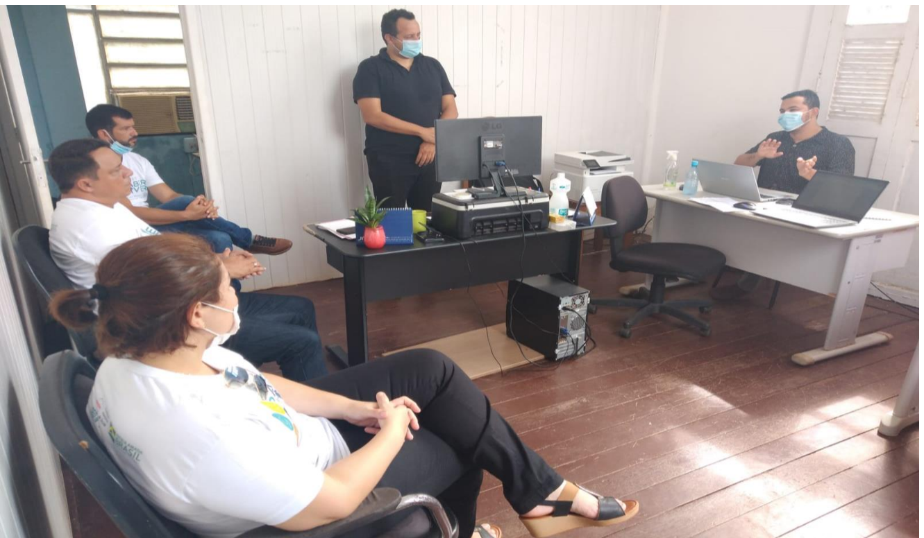
Figura 2: Reunião com os coordenadores e membros dos Comitês de Saneamento Básico na Defesa Civil de Guajará-Mirim.